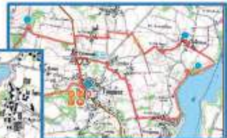
Le circuit des chapelles