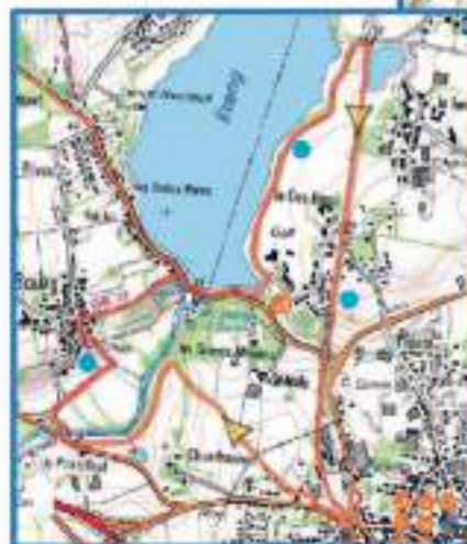
Le circuit du diable au paradis des hortensias