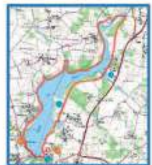
Le tour du Lac au Duc